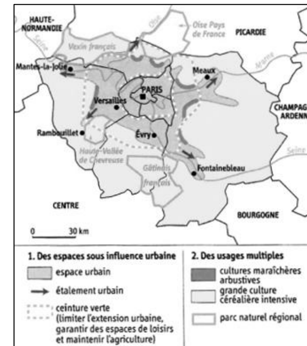
ESPACES RURAUX D'ÎLE-DE-FRANCE