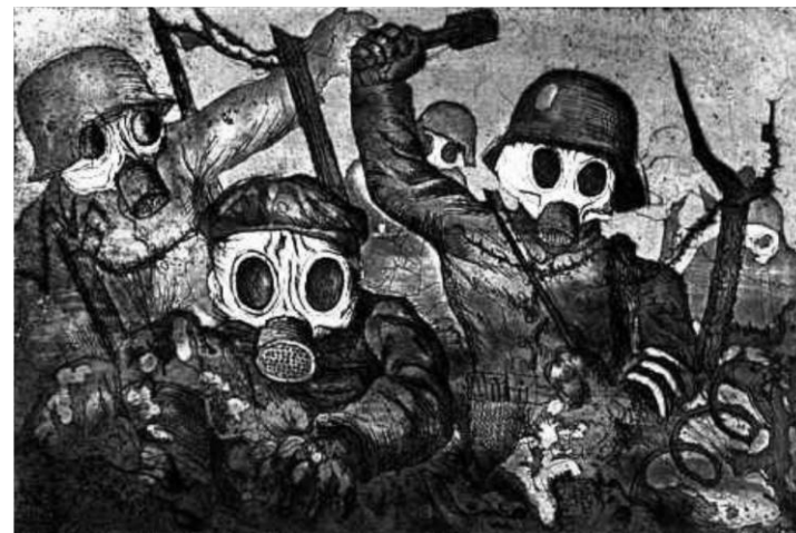
Otto DIX - Scène de Guerre - 1924